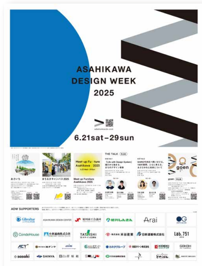
[旭川・近郊広域配布メディアイメージ]