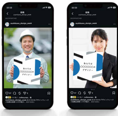
[デジタルメディア施策イメージ]